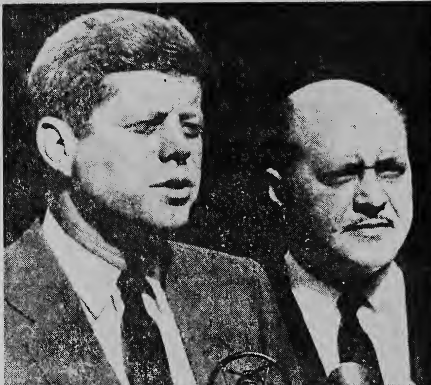
NEGER DEN PUESTO IMPORTANTE — Presidente electo di Estados Unidos, Kennedy, a nombra e negero Robert Weaver (na drechi) pa un puesto haltu den su gabinete nobo. Nunca anterior un hende di calar a hanja un puesto haltu asina den gobierna mericano.

SAN NICOLAS. — Na 1960 un cantidad record d' herde a mira e presentacion di peliculanan pa e Public Relations Department, cualnan frecuentemente ta worde teni na varios sitio di e isla. Anja pasa nan a duna 87 presentacion gratis cualnan a worde bisita pa nada menos cu 15.689 personas: casi e dobel den 1959. Di tur e peliculanen presenta esun di e „Weganan Pan Americano”, un pelicula traha na encargo di Esso, tabata e mas popular.